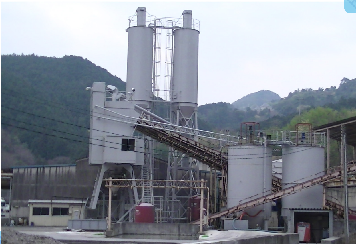
製造能力 25m 3 /H バッチ混練